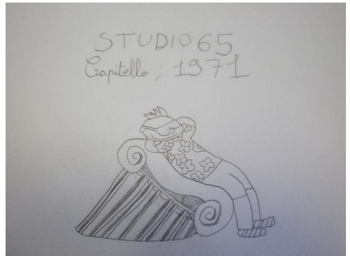
Dessin réalisé lors de la découverte de l'œuvre en mettant en valeur la fonction de l'objet.