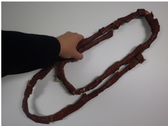
Trombone surdimensionné réalisé par Méziane (papier de verre, carton).