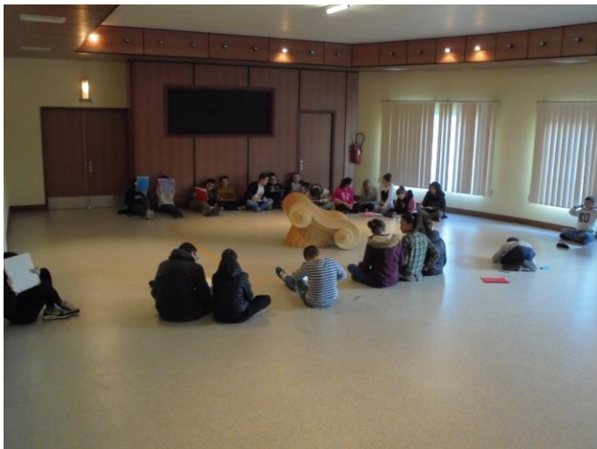
Vue de l'exposition du fauteuil Capitello dans la salle polyvalente avec les élèves au travail.