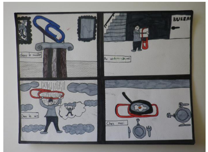
Mise en scène du trombone.