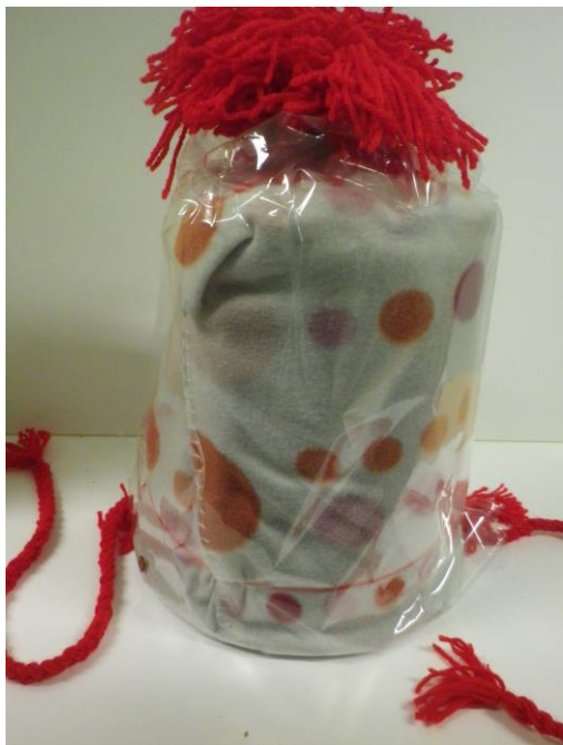
Bonnet géant réalisé par François ( laine tissu, plastique transparent).