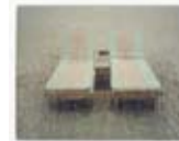
Felix Gonzalez-Torres Untitled 1991 Coll. De Pont, Tilburg (long term loan H+F Collection) © The Felix Gonzalez-Torres Foundation.