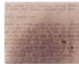
Felix Gonzalez-Torres Untitled (Love Letter From the War Front) 1988 Coll. De Pont, Tilburg (long term loan H+F Collection) © The Felix Gonzalez-Torres Foundation. Photo Peter Cox