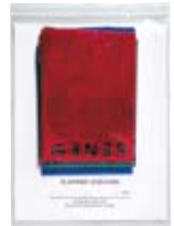
General Idea Placebo (helium) 1992-2001 Coll. FRAC Nord-Pas de Calais