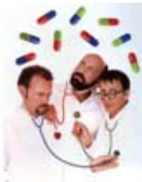
General Idea Playing Doctors 1992 © General Idea