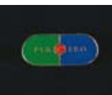
General Idea Placebo Pin 1996 Coll. FRAC Nord-Pas de Calais © General Idea