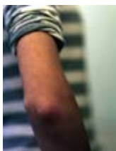
Anna Katharina Scheidegger Hortense Extraits de la série de photographies «Comment on peut vivre...» 2009 Coproduction FRAC Nord-Pas de Calais et Hôpital Saint Vincent de Paul dans le cadre du programme national «Culture à l'hôpital»