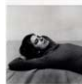
Peter Hujar Portrait de Susan Sontag vers 1974 Photographie noir et blanc Coll. Frac Limousin © P. Hujar et ayant droits