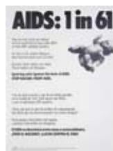
Gran Fury AIDS: 1 in 61 1998 Coll. Manuscripts and Archives Division. The New York Public Library. Astor, Lenox and Tilden Foundations