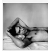
Peter Hujar Autoportrait 1974 Photographie noir et blanc Coll. Frac Limousin © P. Hujar et ayant droits