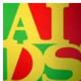
General Idea AIDS 1987