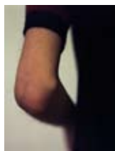
Anna Katharina Scheidegger Daphne Extraits de la série de photographies «Comment on peut vivre...» 2009 Coproduction FRAC Nord-Pas de Calais et Hôpital Saint Vincent de Paul dans le cadre du programme national «Culture à l'hôpital»