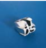
General Idea AIDS Ring 1993-1996 Coll. FRAC Nord-Pas de Calais